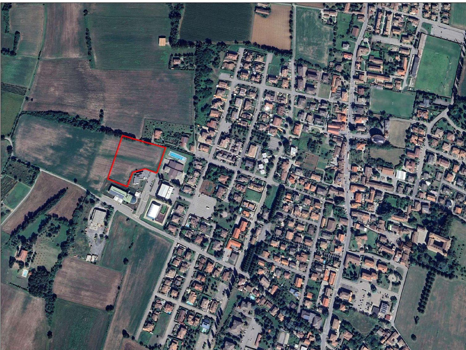
Individuazione del fabbricati oggetto di intervento in ortofoto